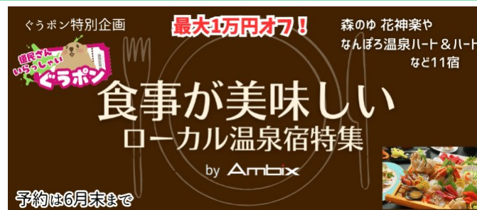
宿泊予約サイト「ぐうたび北海道」に掲載するキャンペーン画像

ぐうたび北海道、食事の口コミ評価が高い道内ローカルホテルチェーンとコラボ 食事が美味しいローカル温泉宿企画 ～道民限定のお得な宿泊プランでオフシーズンの北海道旅行を応援～ 令和7年4月1日より予約開始